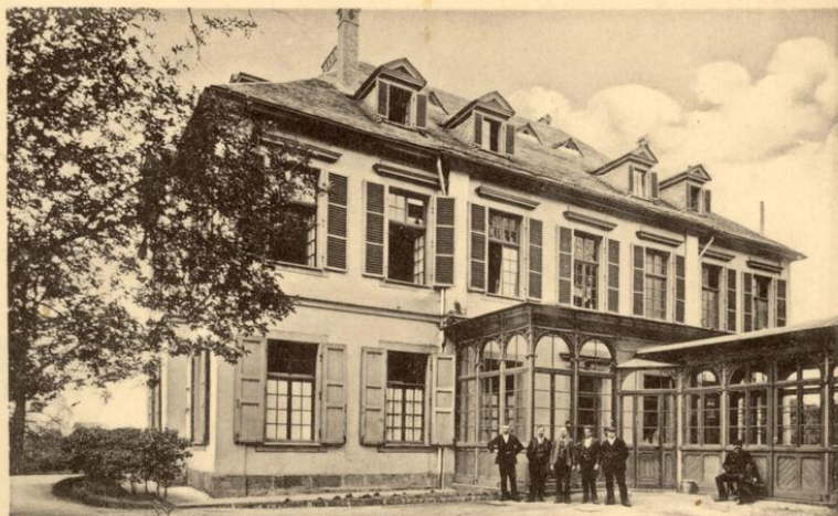
Rohrbach bei Heidelberg